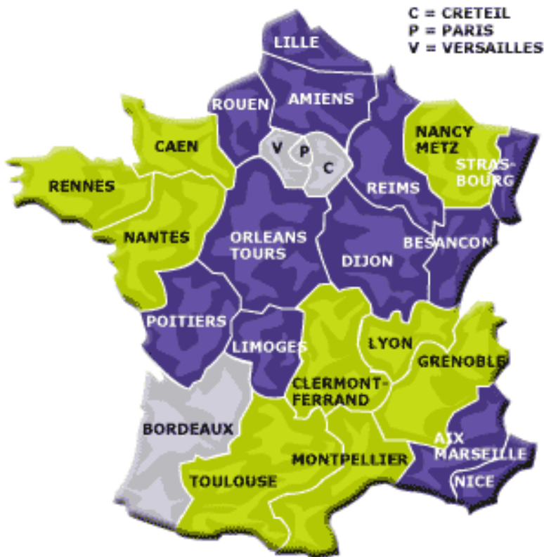
Abb. 2 Die Akademien

Detail: siehe http://www.education.gouv.fr